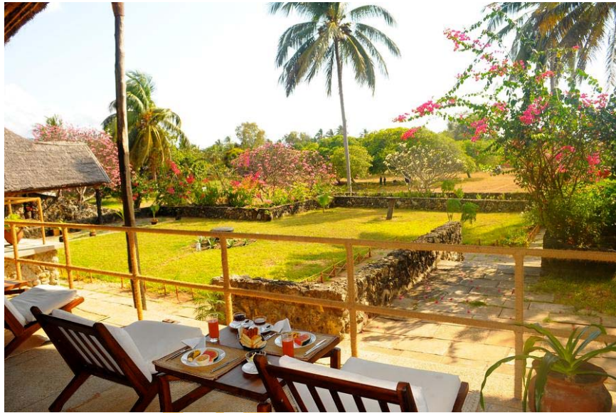
PIC: Udsigt fra hotel værelset

I slutningen af marts måned lanceredes en ny dykkerrejse til det biodiverse hotspot Mafia Island. Dykkersafari Mafia, 10 dage/7 nætter på destinationen, med alt inklusive. Dyk inklusive leje af udstyr, ophold i luksus resort (halvpension) flyrejse både international og lokalt og udflugt på øen er en del af programmet. Dykkersafari turen er for dykkere med PADI OWD certifikat.