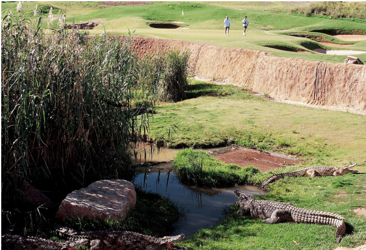
PIC: Lost City hul 13